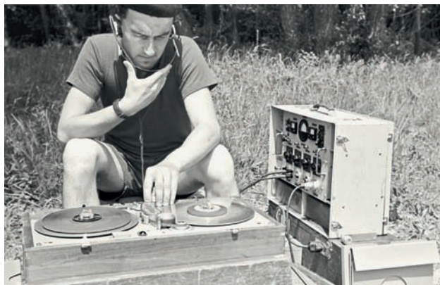
Práce zvukaře při natáčení scén na Váhu

Menzelův citát naznačuje, jak zřejmě nakonec vznikla definitivní verze scénáře, potažmo výsledná podoba filmu – Cesta do pravěku totiž zřejmě vstřebala motivy z obou původně zvláště chystaných projektů. Ačkoli scénosled Výletu do vesmíru obsahuje i pasáže téměř shodné se scénami v Cestě do pravěku , pro zpracování pravěkého tématu se stala klíčovou spíš Cesta života , jež se dostala minimálně do fáze filmové povídky. Tematický plán ji přibližoval jako „pokus o skutečně vědecký film pomocí loutkového triku, kde na základě přísně vědecky zjištěných skutečností bude vytvořen realistický obraz o minulosti naší Země a o vzniku a vývoji života na ní až po objevení se člověka“. Snímek měl sestávat z několika částí propojených hraným rámcem v jeden celek, což do značné míry připomíná právě způsob vyprávění v Cestě do pravěku . 153 Z dochovaných materiálů se přesně nedozvíme, proč se Zeman přiklonil k populárně-naučnému záměru. Tento koncept nicméně lépe odpovídal předpokladu „výchovy uměním“ a sliboval jistější a snazší prosazení látky do výroby. Jak píše ve svém pří-