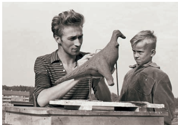
Vytváření modelů pravěkých zvířat – ptáka phororhaca a ještěra trachodona