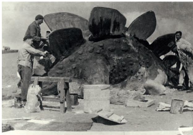
„Stavba“ modelu stegosaura v životní velikosti