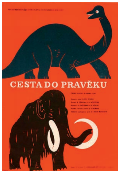
Plakát k českému uvedení Cesty do pravěku

skupin, 135 což se přímo dotklo také filmu pro děti. Tento žánr se v českém prostředí začal teoreticky i prakticky formovat bezprostředně po roce 1945, avšak jeho cílený rozvoj a standardizace nenastaly dříve než v polovině 50. let. Zaměřili se pouze na dlouhometrážní a středometrážní hranou tvorbu od zestátnění do roku 1955, kdy měla premiéru Cesta do pravěku , spatříme vrchol produkce v roce 1954 s pěti dokončenými filmy. Předtím vznikaly ročně maximálně tři hrané snímky. 136 Roční průměr v oblasti loutkového a kresleného filmu činil přibližně pět titulů určených dětskému publiku. 137