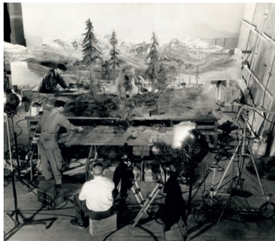
Fotografie z ateliérů při snímání scény z močálu a výjevu s mamutem

Scénosled Výletu do vesmíru začíná srazem školního redakčního kroužku, kde se zrovna řeší příspěvek o pravěké výpravě, který pro časopis sepsali čtyři titulní hrdinové příběhu. Ostatní členové kroužku zpochybňují pravdivost reportáže, a proto chtějí veškeré zážitky znovu přetlumočit. Stěžejní motiv rámce samotné výpravy představuje návštěva filmových ateliérů, kde hochy zaujme raketa připravená k letu do kosmu. V noci se tajně vplíží na palubu a odcestují na neznámou planetu ve vývojovém stadiu pravěku, kde prožívají rozličná dobrodružství. V závěru se scénář vrací zpět do ateliérů a otevřeně přiznává, že celý výlet se mohl uskutečnit jen díky filmové technice, která „dokáže oživit ty představy života dávno minulých dob, jak je věda přesně zjistila“. 151