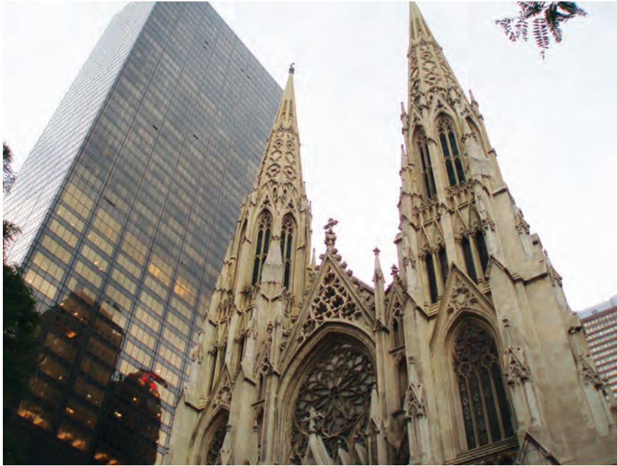
148. James Renwick jr., katedrála sv. Patrika v New Yorku, 1858–1878.

sv. Petra, jenž se na rozdíl od předchozího dochoval ve zhruba původní podobě z let 1836–1840.