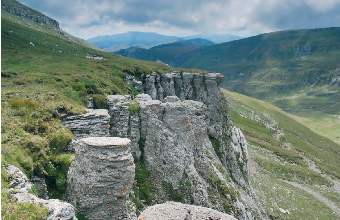
V pohoří Bucegi v Rumunsku je taxon častý