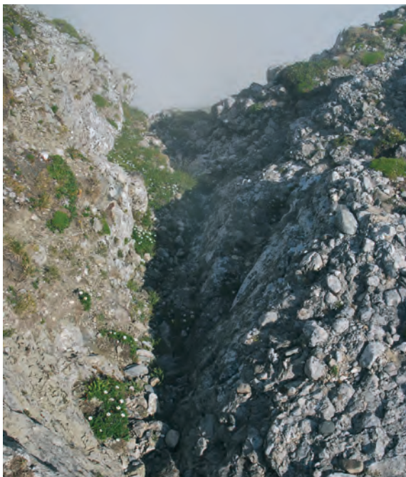
Skalní stěny a štěrby s výskytem taxonu