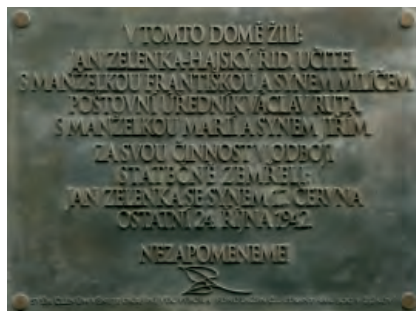
Pamětní deska na domě čp. 1837 v Biskupcově ulici 4 (AA)