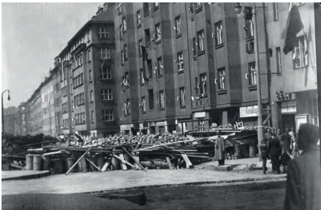
Barikáda u kina Aero v Biskupcově ulici, 7. května 1945 (MDH)