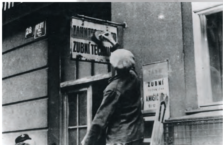
Zakrývání německých nápisů v Biskupcově ulici, 4. května 1945 (MDH)