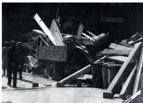
Barikáda u kina Aero, 7. května 1945 (MDH)

■ V kině Aero byli bezprostředně po skončení bojů v květnu 1945 shromažďováni zajatí Němci.