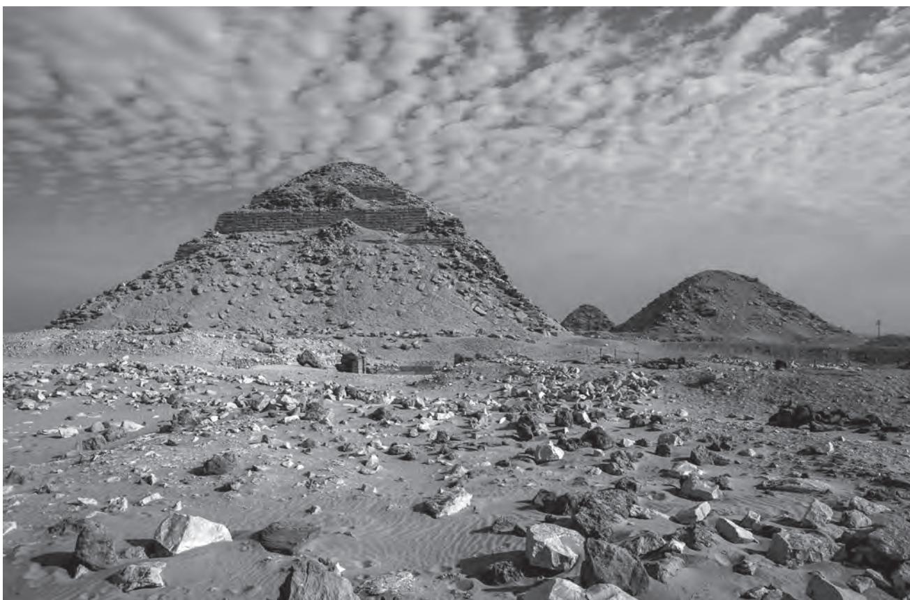
Neferirkareova pyramida

a improvizovaně dostavěli Neferirkareovi nástupci Raneferef a Nyuserre. Ricke Borchardtovu rekonstrukci odmítal a tvrdil, že stávající podoba měl mít zádušní chrám od samého počátku, a to včetně použití lehkých materiálů (s výjimkou kamenné kultovní části) a severo-jihní orientace sloupového dvora, a že předlohou mu byl zádušní chrám Šepsekafův. Maragioglio a Rinaldi odmítli jak Borchardtovu, tak Rickeho teorii o stavebních fázích a prohlašovali, že pouze kamenná část byla dokončena a vyzdobena za Neferirkare a zbytek (různě modifikovaný) byl vybudován až za Nyuserrea.