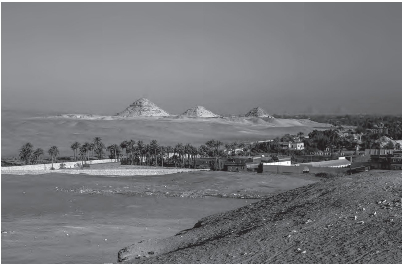
Pohled na Abúsír ze severní Sakkáry. V popředí leží raně dynastické pohřebiště v jižním Abúsíru, které zkoumal Hans Bonnet, a ostrůvky zeleně vyznačující polohu někdejšího Abúsírského jezera

chrámu. Tak či tak, je bezpochyby příznačné, že přesně v chrámu v Abú Ghurábu se imaginární přímka spojující Abú Ghuráb s Heliopolí protíná s další symbolickou linií, jež spojuje Veserkafovou pyramidu v Sakkáře s Chufuovou Velkou pyramidou v Gíze. A Chufu a Racheš, jak už víme, také vyjádřili umístěním svých hrobek oddanost slunečnímu bohu z Heliopole.