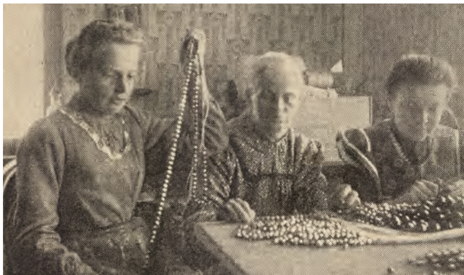
Domácká práce – třídění a navlékání perlí, první čtvrtina 20. století, dobová fotografie

ale i v širokém okolí se domácké dělnice věnovaly pletení, háčkování a vyšívání dámských perličkových kabelek. Tato výroba byla tradičně domovem – nezávisle na jabloneckém průmyslu – v Krušnohoří, a to s centry v saském Annabergu a českých Vejprtech.