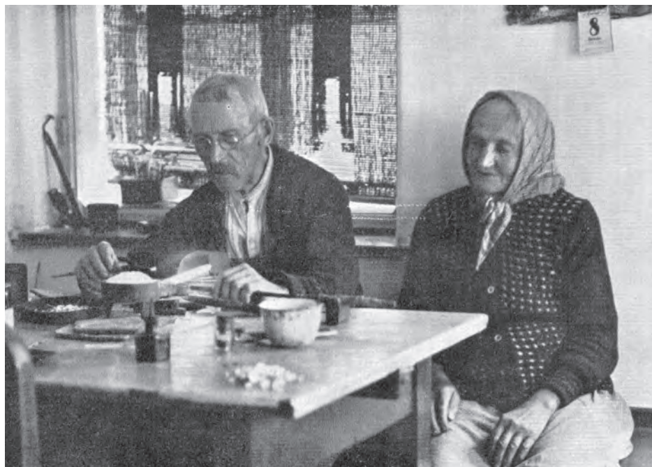
Domácká práce nad sklářským kahanem, první třetina 20. století, dobová fotografie