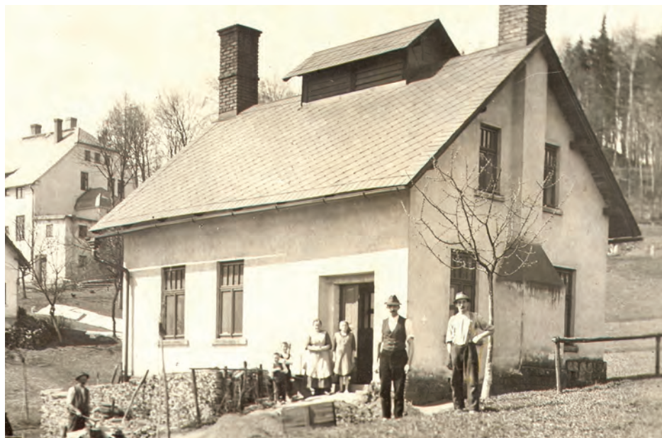
Mačkárna na Jablonecku, první třetina 20. století, Sběrka MSB