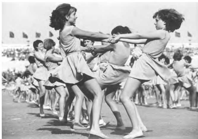
17. Vystoupení starších žákyně s názvem Má země je kvetoucí louka na Strahovském stadionu při spartakiádě 1965.

dříve měla být pojata výzdoba Strahovského stadionu. „Autoři při tvorbě obsahového zaměření výzdoby zvolili takové prvky výzdoby,“ psal autor koncepce výzdoby architekt Josef Hrubý, „které mají působit více podvědomě bez snahy ve formě i obsahu po násilném přiblížení některých skutečností.“ 9