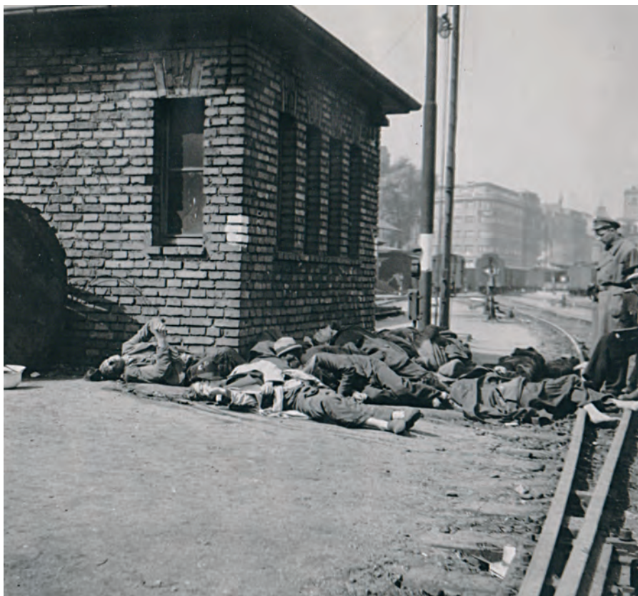
Část z více jak 50 zavražděných československých občanů na Masarykově nádraží v Praze 8. května 1945

u řady služeben gestapa a soudních budov (Český Těšín, Brno, Jihlava, Třešť, Kolín). Masakry v pobočkách koncentračních táborů a při pochodech smrti jsou zvláštní kapitolou osudu mnoha tisíc zavražděných lidí.